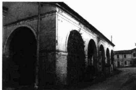
Prospetto principale del corpo padronale La testata ovest dell'annesso e la barchessa ad esso poggiata Fornici della barchessa